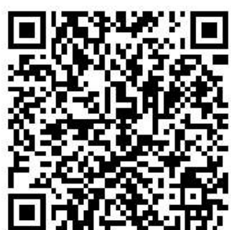
扫描二维码观看视频

会关注。 新冠肺炎疫情发生后,学校艺术教育中心充分发挥职能作用,精心策划,组织录制舞蹈视频《盼》,用独特的文艺方式,向奋战在疫情防控一线各行各业的“最美逆行者”致敬,为武汉鼓劲,为中国加油。