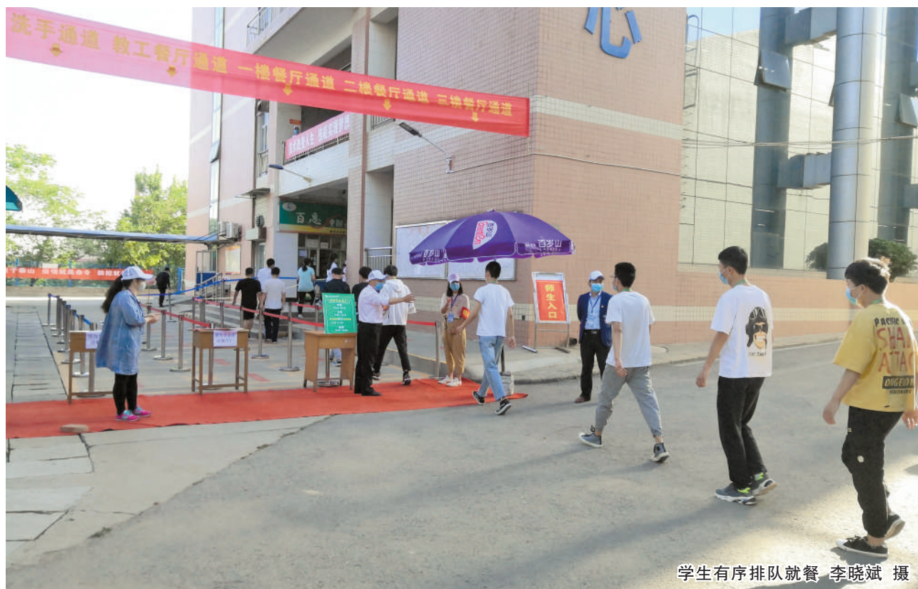
学生有序排队就餐

本报讯(通讯员 李晓斌)5月15日,学校春季学期线下开学了,学生分批有序返校。为避免开学后学生聚集,学校实行了错峰错时上下课、错峰错时就餐的工作安排。学校党委在得知学生就餐比较集中,餐饮中心管理人员紧缺,疏导学生难度较大的情况下,向全院教师党员干部发出志愿服务的号召,积极组织“陕铁院疫情防控用餐环节党员志愿岗”,确保了疫情防控封校期间,顺利实施错峰错时就餐安排。