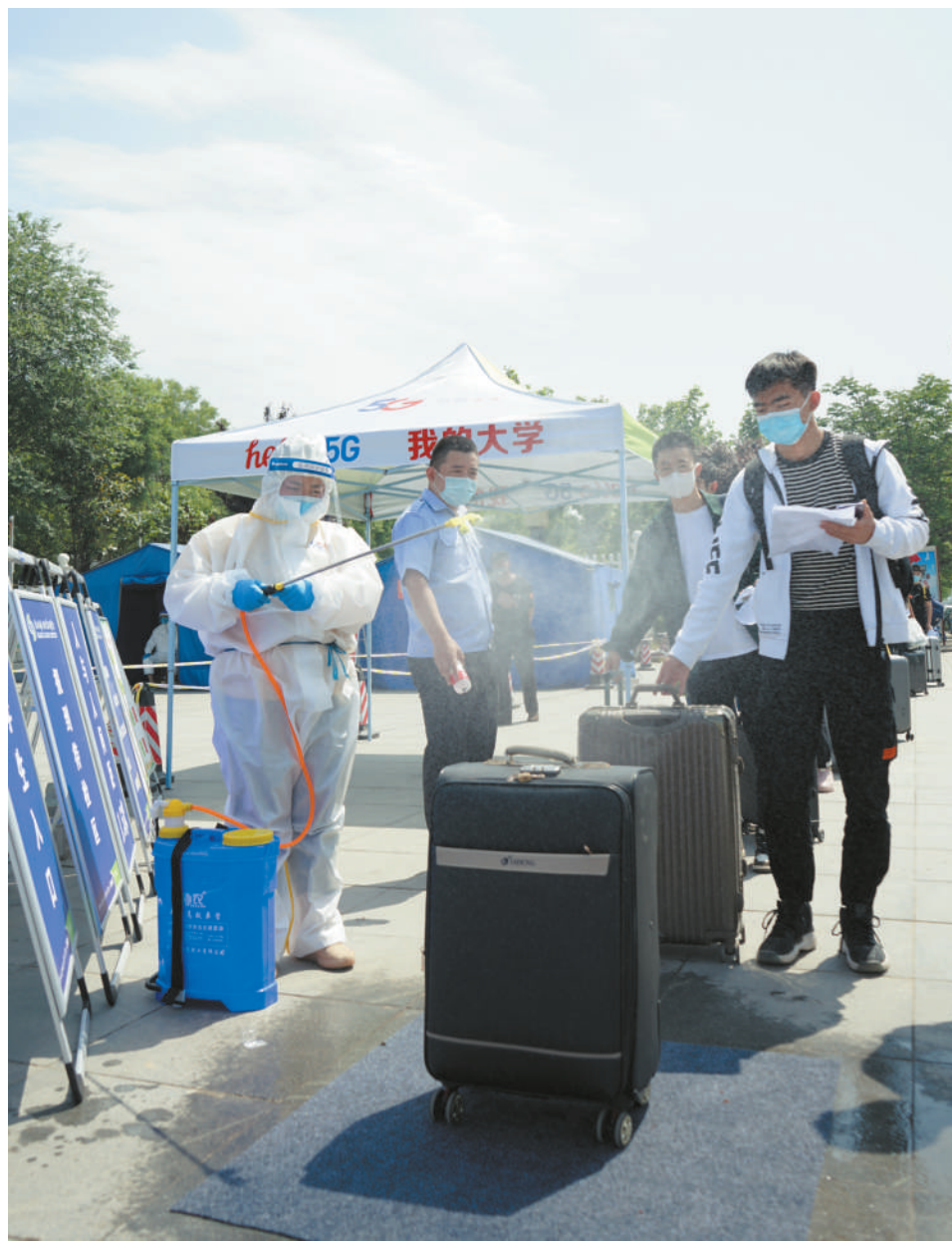
对行李物品进行消毒

本报讯(记者 王莹)5月15日,学校大二大三学生分期分批、错峰错时有序返校。“超长版寒假”终于结束,临渭、高新两校区校门口,学生们自觉间隔一米排队,接受入校体温检测,秩序井然。沉寂已久的校园终于迎来了蓬勃朝气。